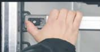
Easylock – snabbblås på bakbommarna

Högsta säkerhet och funktion kombinerat med extra fin design. Glasfiber, Sandwich (isolerade) väggar.